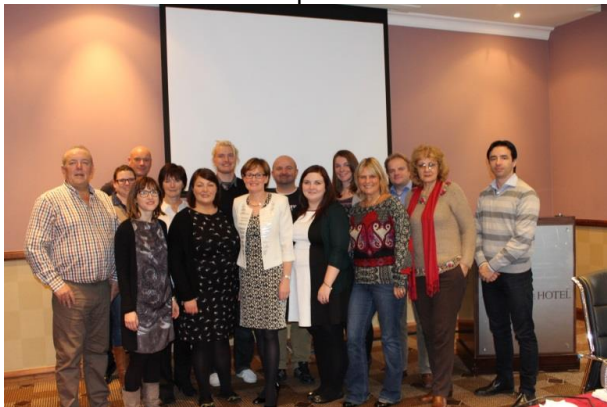
The PINECL Project Partners with MEP Mairead McGuinness

In einer virtuellen Welt können Menschen mit gemeinsamen Interessen miteinander in Verbindung treten, egal wo diese leben. Soziale Netzwerke sind ein mächtiges Instrument für BewohnerInnen von ländlichen Gebieten sowie auch Dienstleistungsanbietern. Das ist die Hauptbotschaft, die das PINECL Projekt auf der Ebene der Politik als auch auf der Ebene der Praxis transportieren möchte.