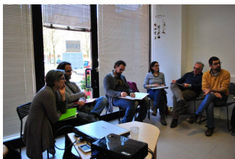
Parents in Italy

Während der Ausbildung erfahren Eltern alle wesentlichen Elemente der frühkindlichen Pädagogik im Detail: