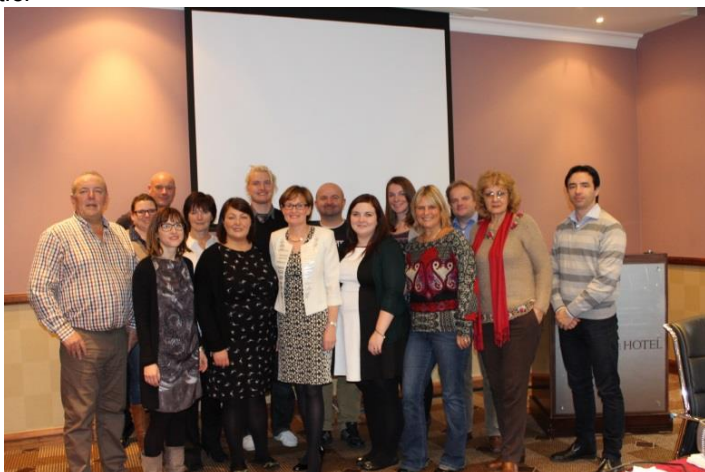
The PINECL Project Partners with MEP Mairead McGuinness

În lumea virtuală, oamenii cu interese comune se pot întâlni, indiferent de locul în care trăiesc. Rețelele sociale au un potențial puternic pentru locuitorii din mediul rural, cât și pentru furnizorii de servicii. Acesta este mesajul cheie pe care proiectul PINECL îl va promova la nivel de politici și practici